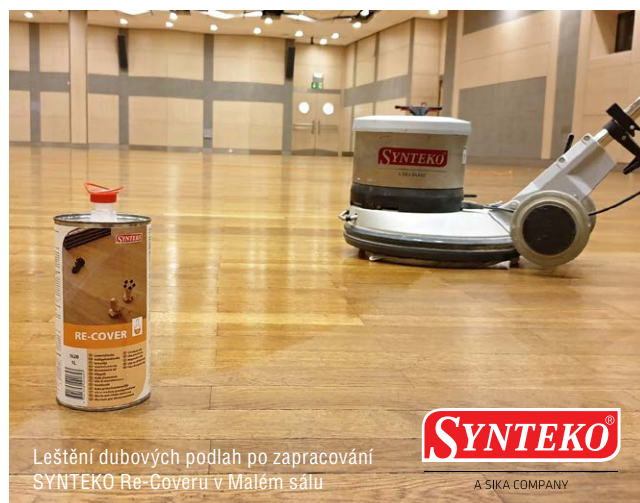
Leštění dubových podlah po zapracování SYNTEKO Re-Coveru v Malém sálu