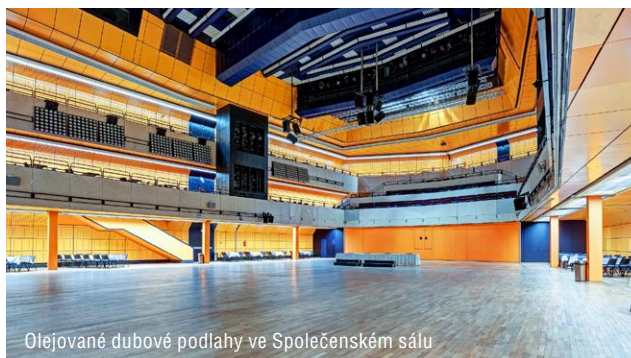
Olejované dubové podlahy ve Společenském sálu