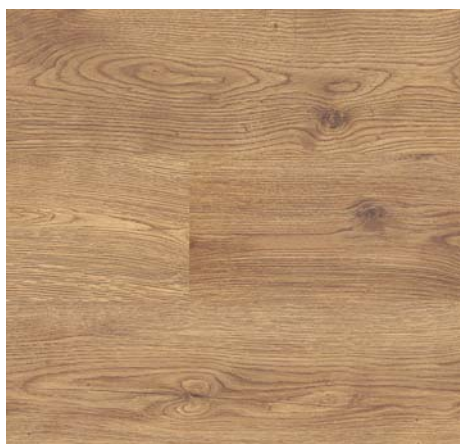
FV 55089 Dub Grand