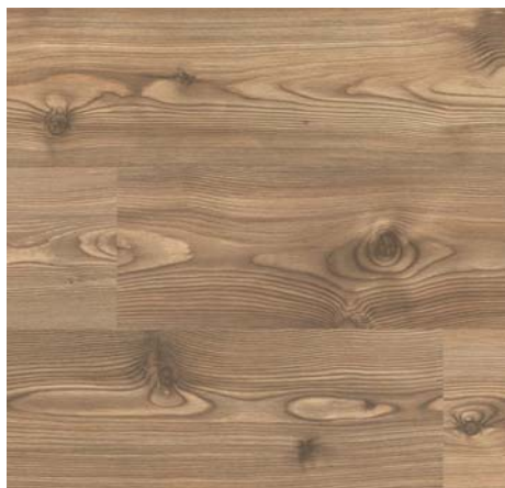
F 75011 Borovice kanadská