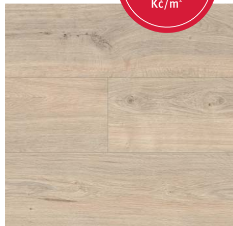
FV 55139 Dub Marty