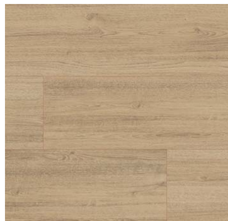
FV 55043 Dub Charm přírodní