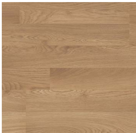
F 84022 Dub Colmar