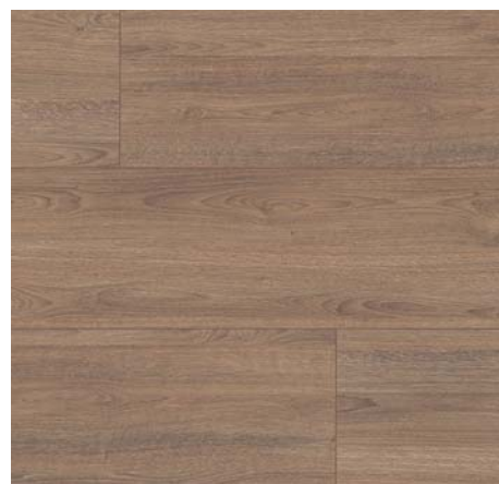
FV 55045 Dub Charm hnědý