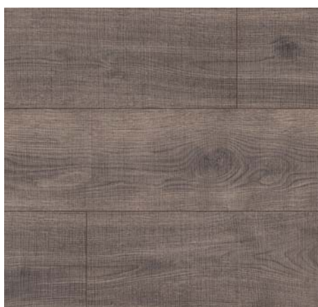
FV 54019 Dub Grove tmavý