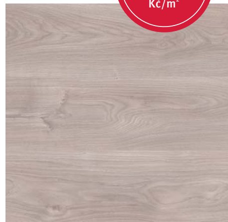
F 75020 Dub Belfort stříbrný