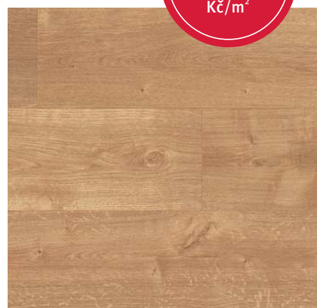
FV 54034 Dub Light