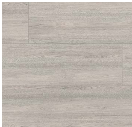
FV 55044 Dub Charm šedý