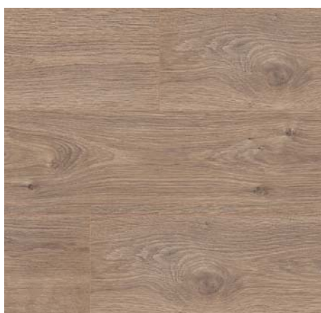
FV 54027 Dub Corte