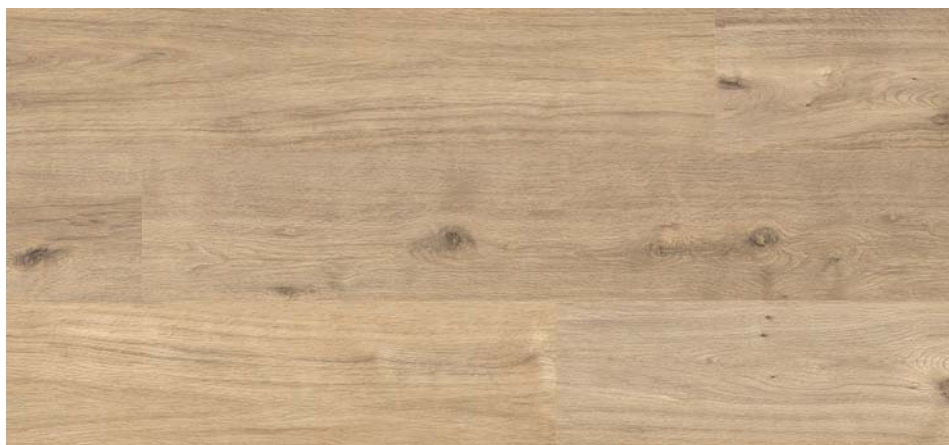
FV 55006 Dub Chiemsee