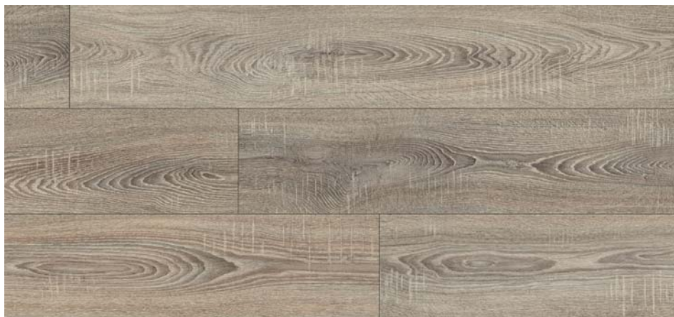
FV 55036 Dub Bonavigo šedý