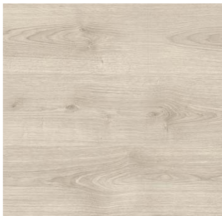
FV 55046 Dub White