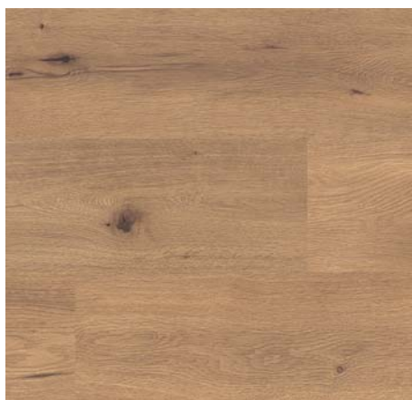
FV 55182 Dub Village