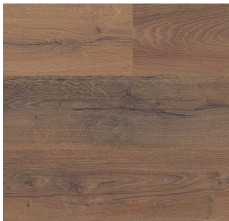
F 85030 Dub Emotion tabákový