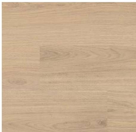
F 75039 Dub Fio