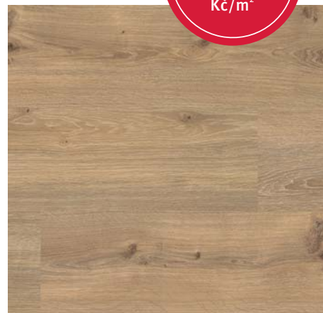
F 85035 Dub Natur