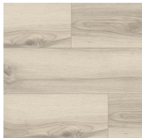
F 85008 Dub Alberta polární