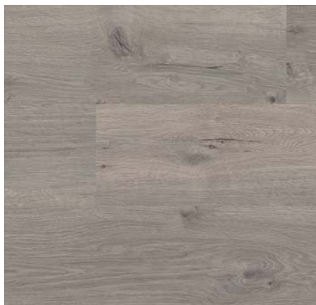
FV 55138 Dub Marty šedý