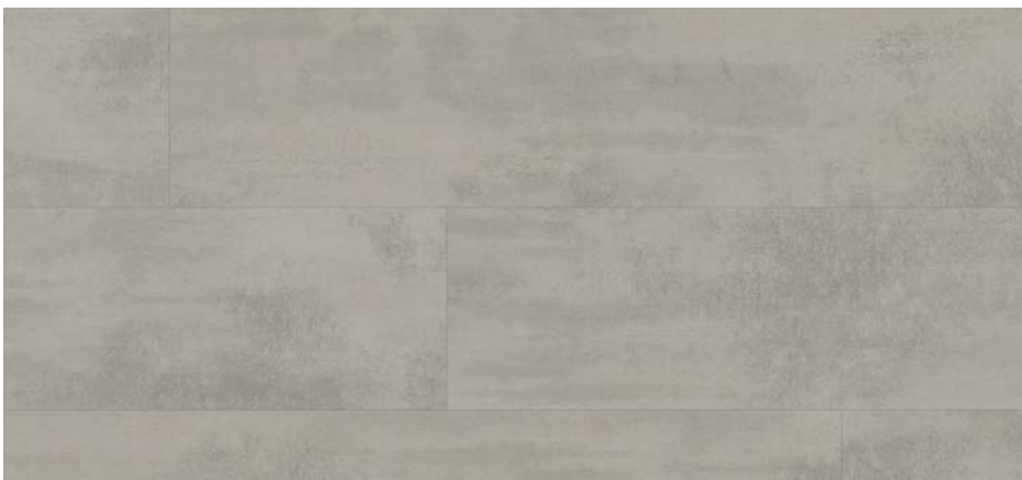
ML 76046 Chromix stříbrný