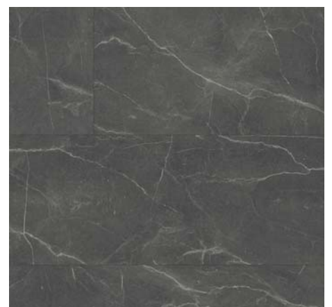
ML 76038 Mramor Parrini šedý