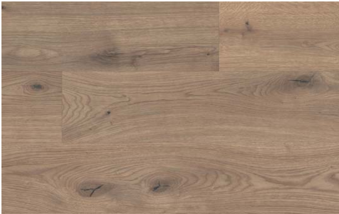
MC 76041 Dub Almington přírodní