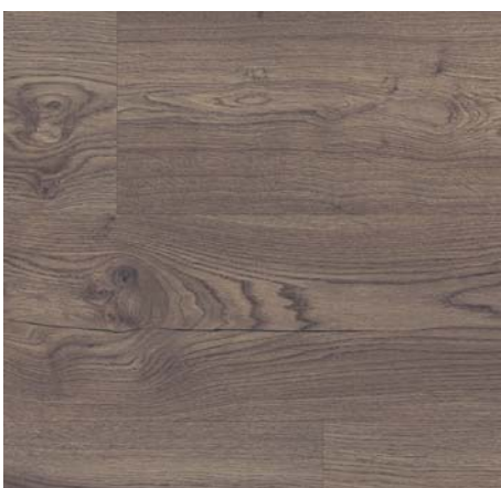
ML 76007 Dub Preston tmavě hnědý