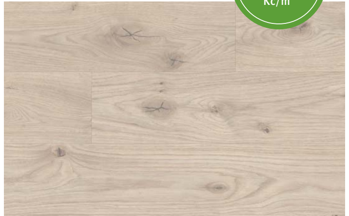
MC 76040 Dub Almington béžový