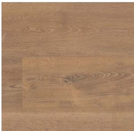
ML 76027 Dub Waltham přírodní