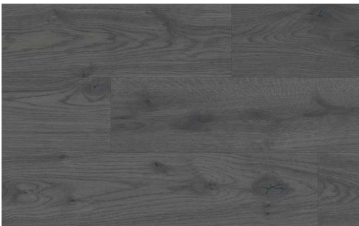
MC 76042 Dub Almington tmavý