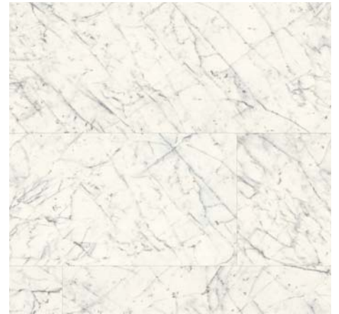
ML 76047 Mramor Berdal