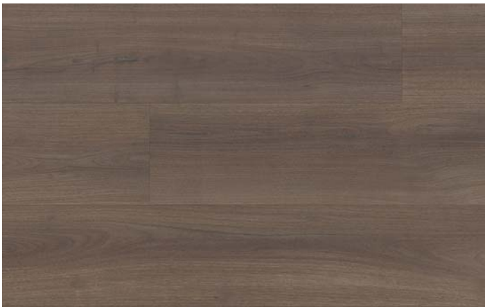
MC 76036 Ořech Bedollo střední