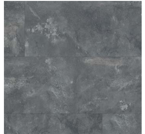
ML 76043 Metal Rock antracitový