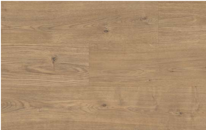
MC 76034 Dub Berdal přírodní