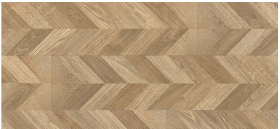
ML 76033 Dub Pitaru