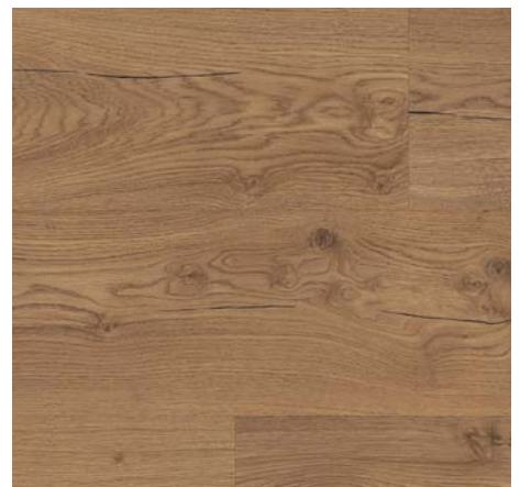
ML 76005 Dub Preston hnědý