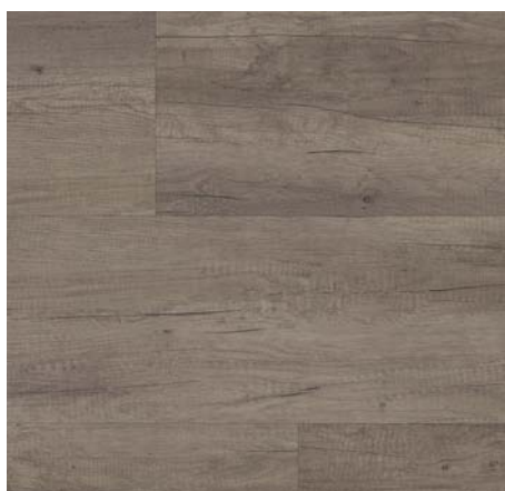
ML 76003 Dub Sereda