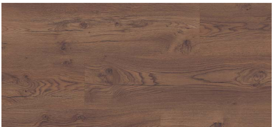
ML 76009 Dub Preston tmavý