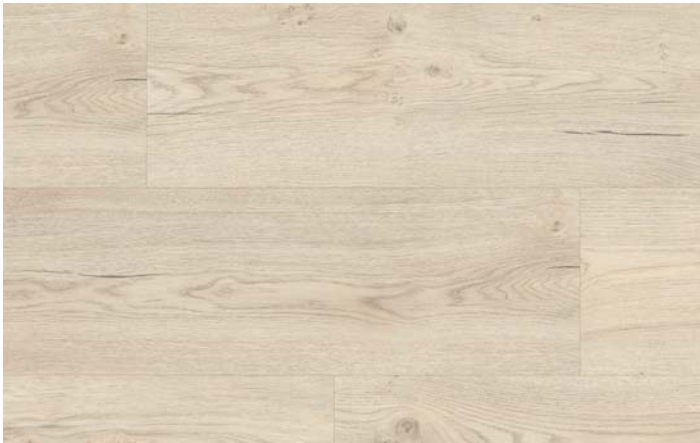
ML 76006 Dub Preston bílý