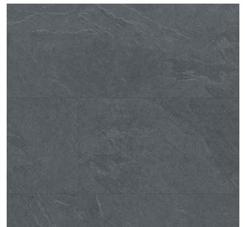
ML 76045 Břidlice Jura antracitová