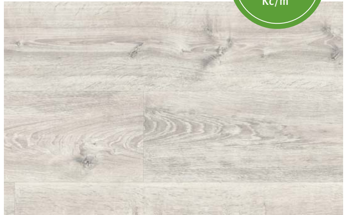
ML 76028 Dub Waltham bílý