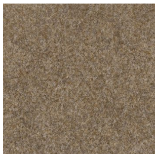
5022 4 m