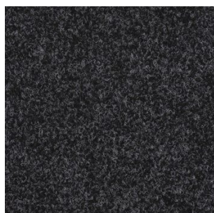
5002 4 m