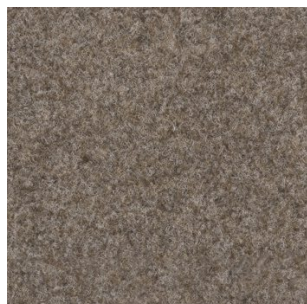
5012 4 m