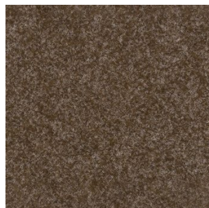
5042 4 m