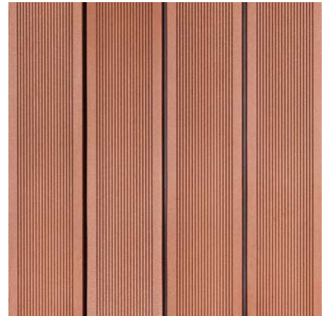
BRAVA 30 Cihlová