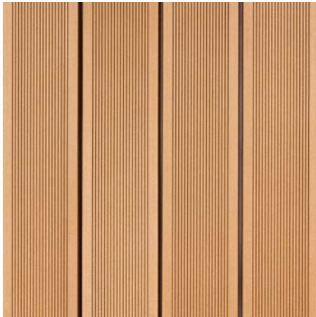
BRAVA 10 Písková