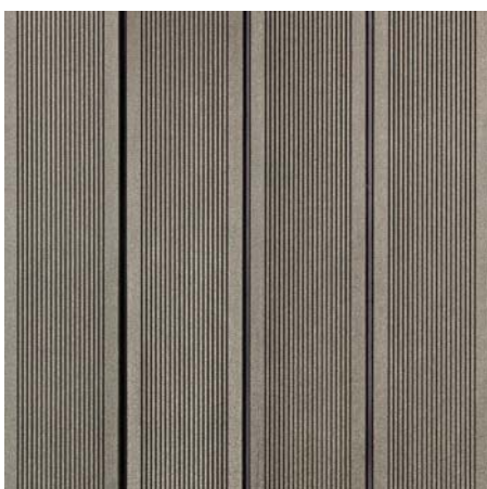
BRAVA 70 Grafitová