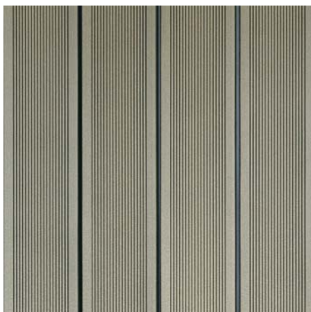
BRAVA 50 Patina