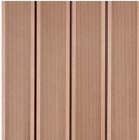
BRAVA 20 Přírodní