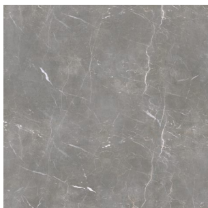
2991 2 / 4 m