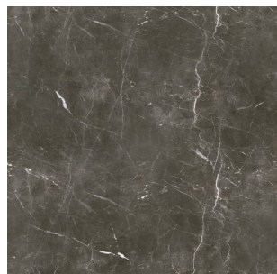
2992 2 / 4 m