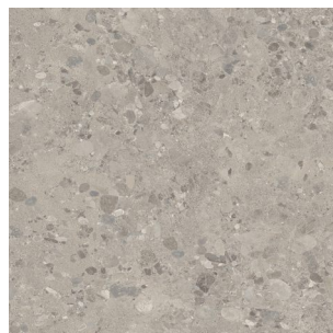
2996 2 / 4 m