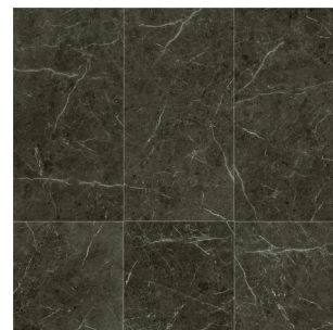
2998 2 / 4 m